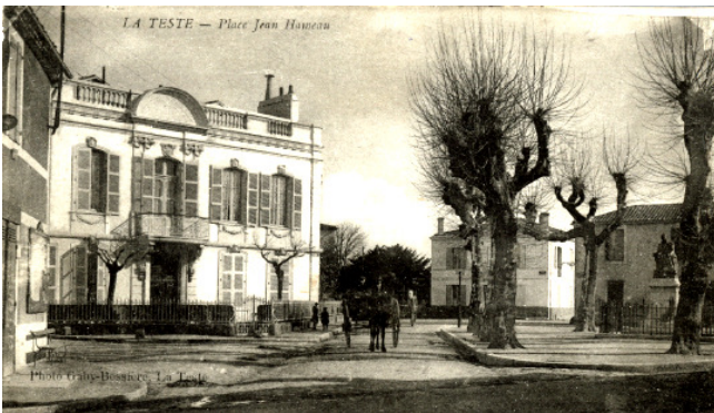
Place Jean Hameau début 20 ème siècle